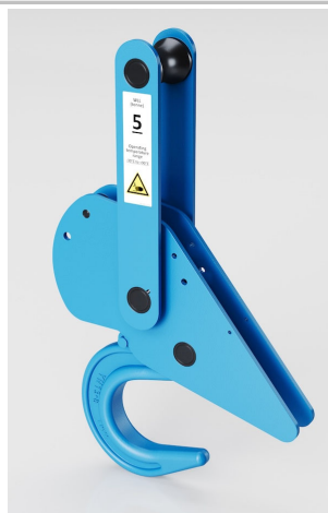
Réf : CRO04-CSXXT-CE

Ce crochet de sécurité est un moyen de levage haute sécurité à décrochage automatique mécanique, grâce auquel l'opérateur n'intervient pas, ce qui réduit drastiquement les accidents.