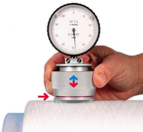
Réf : DUR11-PAXX000

Le duromètre de textiles BLET SCHMIDT est un duromètre analogique adapté à l'industrie du textile. La bille de la pointe assure une grande précision, tout en évitant d'endommager le textile pendant la mesure. Tous les duromètres possèdent une poignée normée qui assure de toujours appliquer la même force sur les mesures.